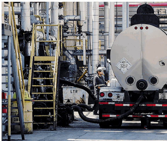
La stima dell'aumento del gas sarà intorno al 28%

Utenze domestiche e manifattura si trovano sotto pressione